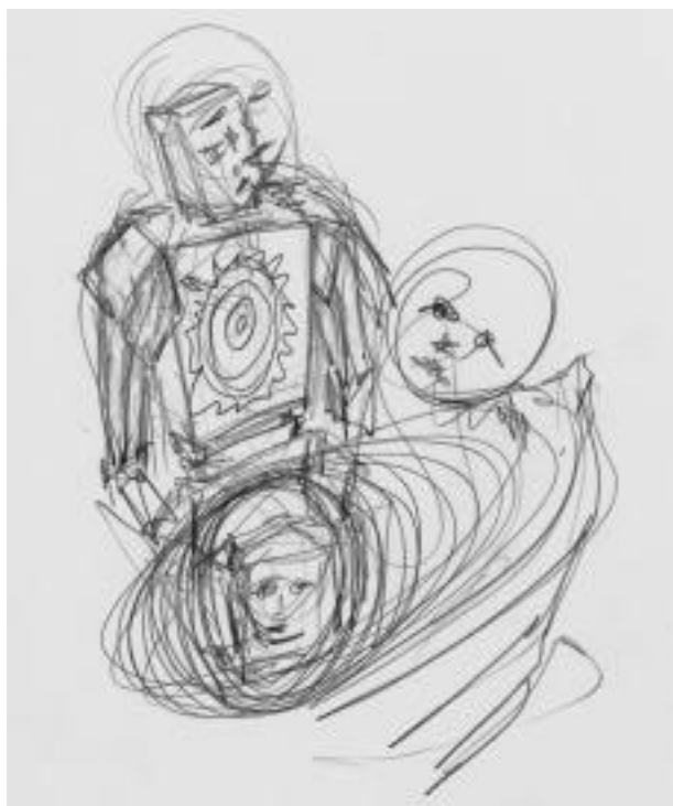
mercoledì 10 aprile 2002 9 e 20 via enrico fermi

di stesso oggetto fatto da me mille le storie diverse che d'ogni mente ch'ascolto