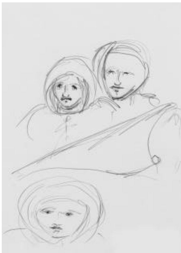
mercoledì 10 aprile 2002

di stesso oggetto fatto da me mille le storie diverse che d'ogni mente ch'ascolto